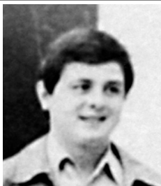
PEDRO JOAQUÍN COLDWELL