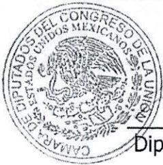
Dip. Sergio Carlos Gutiérrez Luna Presidente

S A L Ó N DE SESIONES DE LA CÁMARA DE DIPUTADOS DEL HONORABLE CONGRESO DE LA UNIÓN.- Ciudad de México, a 4 de marzo de 2025