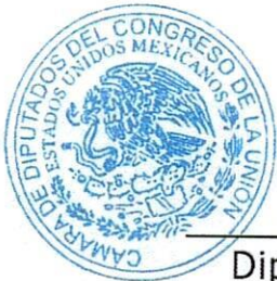
Dip. Kenia López Rabadán Presidenta

S A L Ó N DE SESIONES DE LA CÁMARA DE DIPUTADOS DEL HONORABLE CONGRESO DE LA UNIÓN.- Ciudad de México, a 23 de septiembre de 2025.